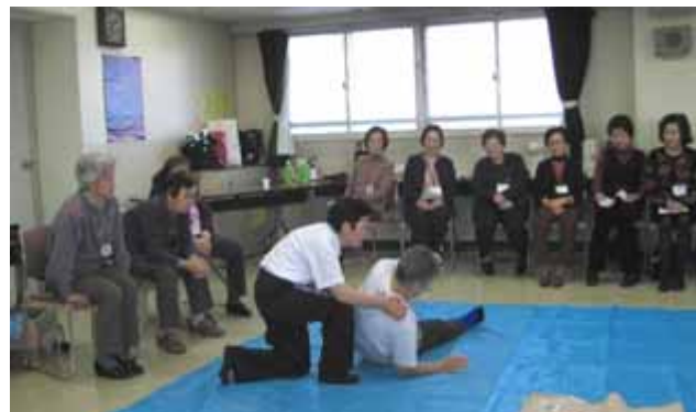
分団講習会 高齢者の方への支援を学びました 21.2.18

大切に奉仕への努力を積み重ね、団員一同奉仕活動に頑張っています。中野区には鷺宮を含め13分団あり、それぞれ次のような活動を行っています。