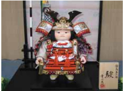
凛々しい五月人形