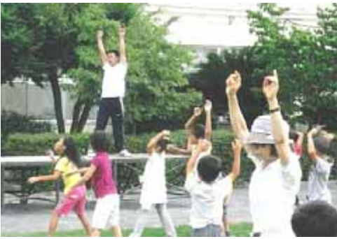
ラジオ体操 若宮小学校