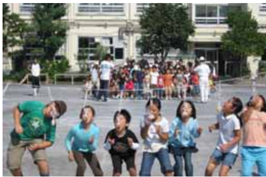
第32回 鷺宮地区まつり