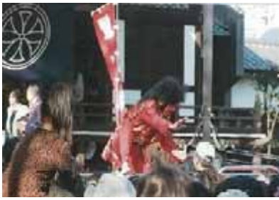
福蔵院での豆まき 1月30日