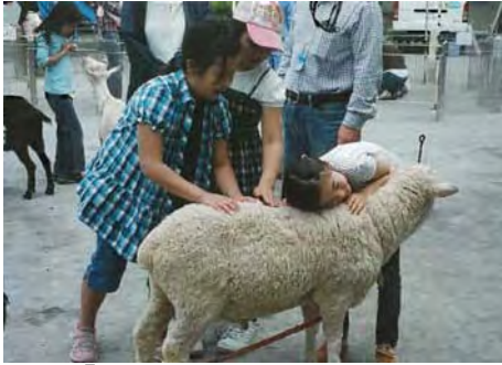
「わ～、ふかふかだね。」 若宮どうぶつ村(5月16日)