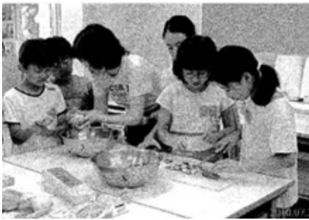
「おいしく出来るかな。」 ナイトインオリーブの様子 (7月21日・22日)