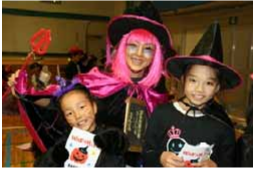
(若宮「セイフティ・ハロウィン」にて)

10月20日、若宮児童館と合同で二回目となるセイフティ・ハロウィンを開催しました。