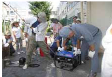
鷺宮三丁目町会 避難所訓練 9/11 鷺宮小学校