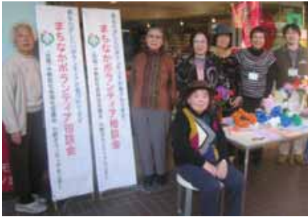
まちなかボランティア相談 (11月4日)