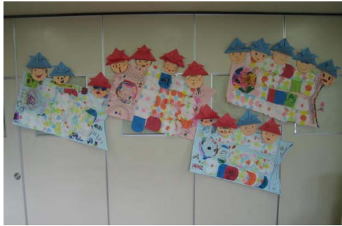
元気に空を泳げるかな(白鷺保育園)