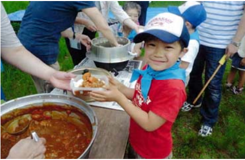
ほくほくのお芋で、おいしいカレー (6/5 いもほりハイキング：鷺宮地区委員会)