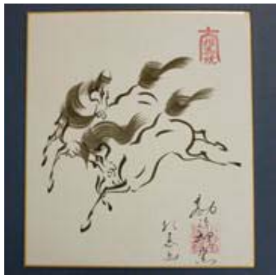
相馬焼の「走り駒」の絵 作 小野田紀恵子氏(紹介は2面)