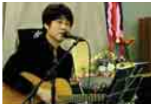
鷺宮都営住宅自治会有志 「3月11日の集い」