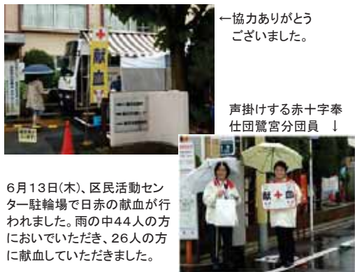
一協力ありがとうございました。