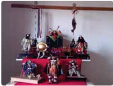
健やかな成長を祝って 五月人形