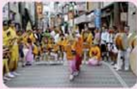
昨年のかせい阿波おどり

【前夜祭】 7月26日(土) 午後4時~8時 【本番】 7月27日(日) 午後5時半~ 8時半