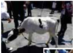
5月18日(日) 若宮児童遊園 (若宮児童館前庭) 『どうぶつ村』