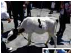
5月18日(日) 若宮児童遊園 (若宮児童館前庭) 『どうぶつ村』