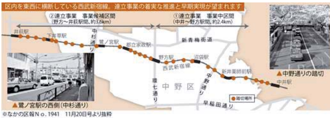
※なかの区図No.1941 11月20日号より抜粋